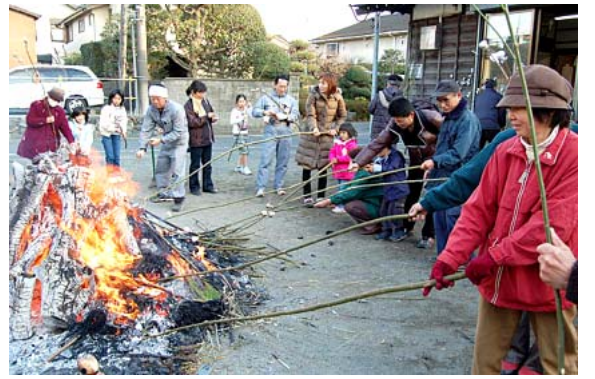
200人が集まったどんど焼

中宿自治会のどんど焼きが1月9日、自治会館前の座間子ども広場で行われ、約200人の近隣住民が集いました。 どんど焼きは小正月の火祭り、門松や正月飾り、書き初めなどを焼き、無病息災を願うその火で団子などを焼いて食べる伝統行事です。中宿では以前、座間公園で行っていましたが、10年程前から同広場で行うようになりました。この日は10kgの団子と、団子を刺す柳の枝を自治会が用意。「座間不動尊の氏子と自治会の美化防災、子