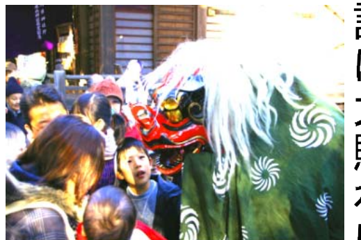
座間神社の獅子舞は子供たちに大人気!